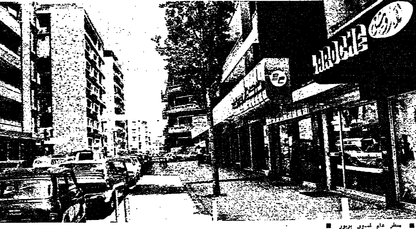
مطر عام لسوق ببربور

أسواق - أسواق وبربور عرضت تحديد وبرميج عليها الأخضر ، لتعود إليها التجهة والبسة والحياء . وبانتظار الإيجابية ، تنتظ جمعيات تجارية بيلة ، أو ردمه عسي أرباحها المسجحة . منها الحدود المتوخ ، ومنها التزم على نفسه كانه جوهره بلع بعد الأحداث . وسنينا ضئيا سبب حركة التمر والاعمار التي منطبت بشكل ملحوظ ، ان الإصاء الداخليه في بيروت ، يكن ان يحول إلى مراكز تجارية بسد مسده ، المراكز المهمة ، الفخمية ، في سره الانتظار . وهذه المراكز - التجمعات هي بديل مرحلي لبيوزة التجار الجدد الذينس راحوا بعد الحرب بينون « جمهوريتهم التجارية » الحرة القائمة بذاتها ، لكن الاقتصاد الوطني ، ولحق الأمانة التي ارتفعت نسب إيجاراتها وقلواتها في ان مرسا . من هذه المراكز الأساسية السوق التجارية التي تركزت في المزرعة ببربور . فهي تختلف من حيث موقعها الجغرافي عن باقي الأسواق ، كما تضم فيها قديم سوق بيروت المدمرة ، محلاتها مرمونة ، كانت أساسا في الوسط التجاري الأصلي ، اضطررها ظروف الحرب إلى الانتقال ، والانتجاع التي موضع ان نسد إليه رأس هيكلتها